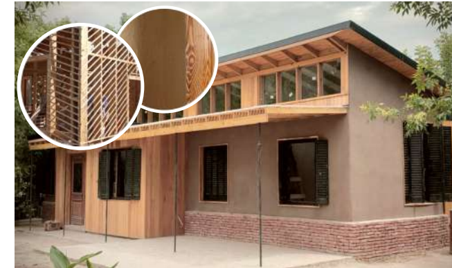
Casa NH. Gral Rodríguez, Prov. Bs. As. Estudio Brahma Bioconstrucción.

Esta publicación del INTI presenta un análisis de la técnica constructiva quincha, adaptada a las necesidades de sostenibilidad y eficiencia energética actuales. Se exploran sus orígenes históricos, materiales y variantes contemporáneas. El estudio detalla los ensayos de laboratorio realizados para caracterizar suelos, determinar la resistencia al fuego y evaluar su conductividad térmica. Además, propone métodos de fabricación sistematizada y repasa el marco normativo nacional e internacional. El objetivo principal de este documento es divulgar información técnica, tanto para el público general como para profesionales del sector, promoviendo esta técnica constructiva como una alternativa simple, replicable y escalable, que contribuya a la mitigación del déficit de viviendas, al ahorro energético y al desarrollo de economías regionales.